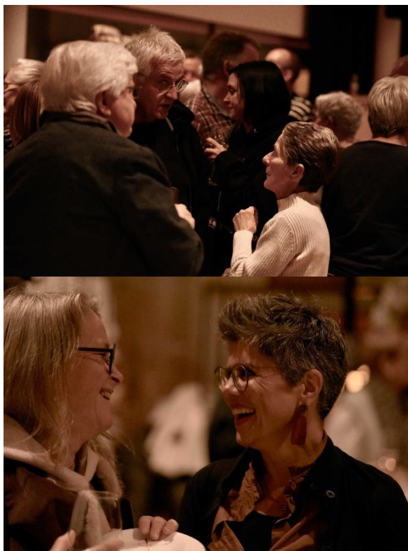
Wichtiger Teil bei einem Anlass wie der Übergabe des Rheintaler Kulturpreises ist auch die Gelegenheit sich zu begegnen und sich auszutauschen.