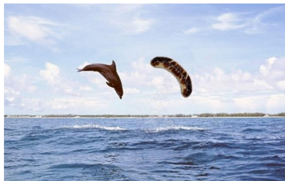
Ausgabe Rheintaler KulturNews 2023 Bild: Beni Bischof, «Wunder im Pazifik», 2020